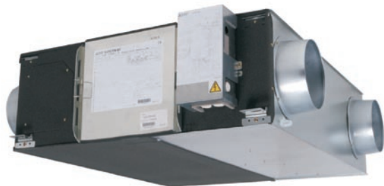
LGH-15RX4 do LGH-100RX4