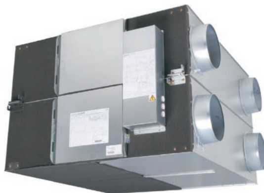
LGH-150RX4 do LGH-200RX4